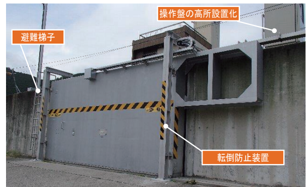
動力化された陸閘（海側より）