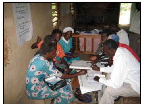
パイロット事業の実施