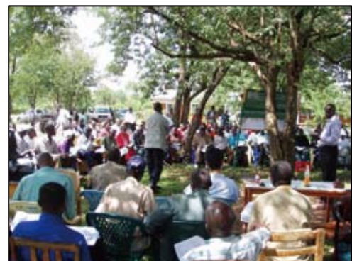
洪水氾濫実績図に関わる住民公聴会の開催

過去の洪水に関する量的データの不足を補うため、洪水が頻発する240km 2 の350箇所で聞き取りを中心とした洪水被害調査を実施して作成。