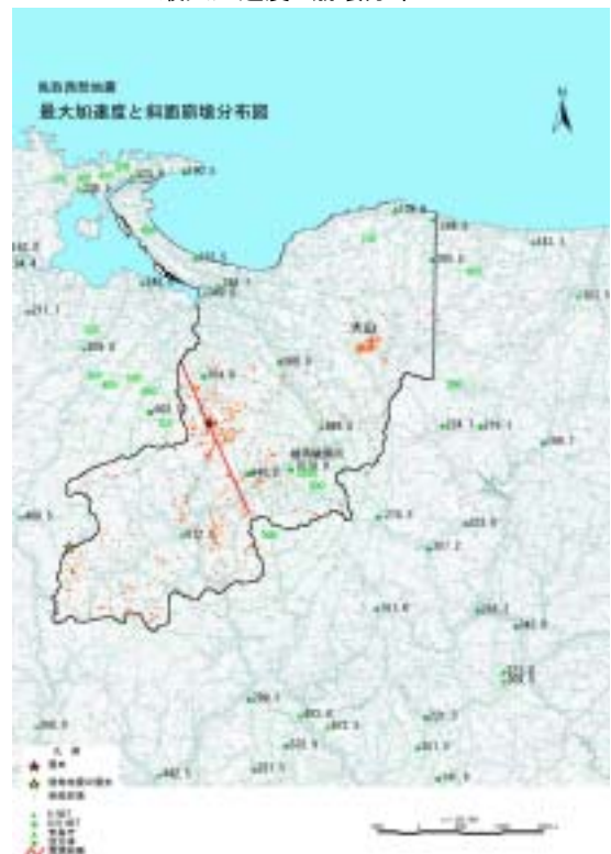
最大加速度と崩壊分布

地震による崩壊に関連する要因の例として、最大加速度と崩壊分布の関係を右図に示す。